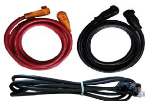
Модель: Кабель RW-M6.1-B

Деталі: Пара кабелю живлення постійного струму 4AWG та комунікаційного кабелю RJ45 з'єднуються з гібридним інвертором, один кінець має водонепроникну клему. Довжину кабелю можна змінювати відповідно до вимог замовника, довжина за замовчуванням становить 1500 мм.