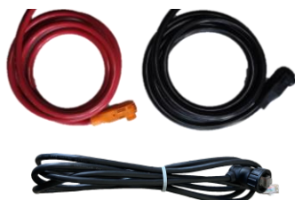
Модель: Кабель RW-M6.1-P

Деталі: Пара кабелю живлення постійного струму 4AWG та комунікаційного кабелю RJ45 з'єднуються з гібридним інвертором, один кінець має водонепроникну клему. Довжину кабелю можна змінювати відповідно до вимог замовника, довжина за замовчуванням становить 1500 мм.