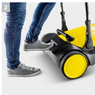
2 Удобная подножка