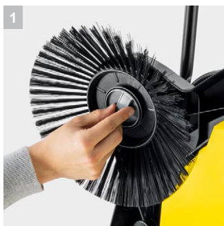
1 Практичный колпачок для боковой щетки.

Идеально подходит для круглогодичного применения на больших и широких площадях и тщательной очистки по краям: подметальная машина S 6 Twin с двумя боковыми щетками, 38-литровым контейнером для мусора и шириной подметания 860 мм.